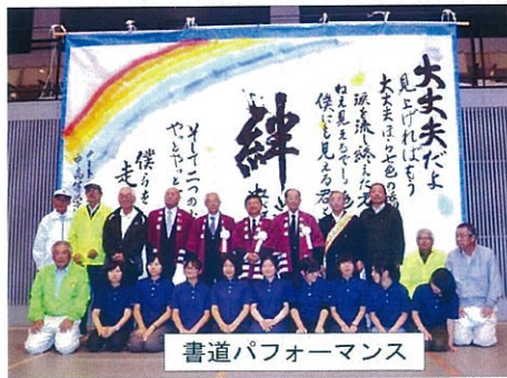
H25.11.3 西区民まつり・書道パフォーマンス