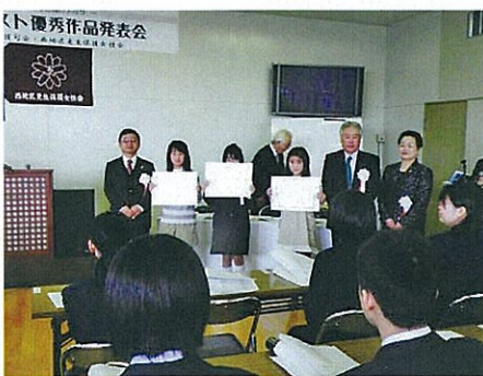
H26.2.22 西区推進委員会において 表彰