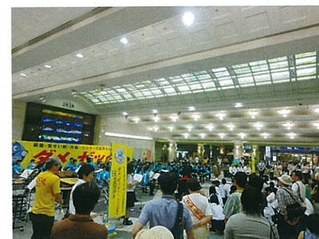
H25.7.5 “社明運動” 一日観察所長行事 セレモニー