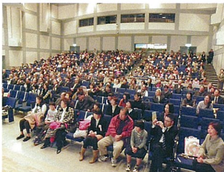
H25.12.25 作文・標語コンテスト表彰式 客席