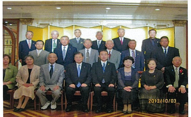
広島県更生保護協会より感謝状を頂いた皆さん。