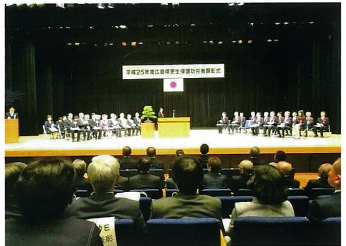
広島県更生保護功労者顕彰式 壇上