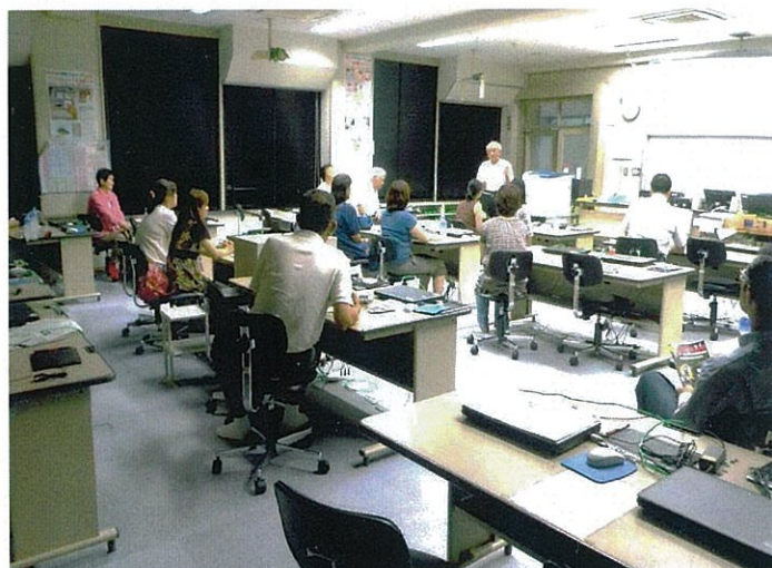
【第四分会】H26.1.26 ビデオ鑑賞・意見交換会