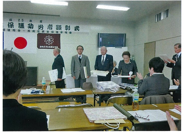
H25.12.5 西地区更生保護功労者顕彰式 全保連理事長 表彰