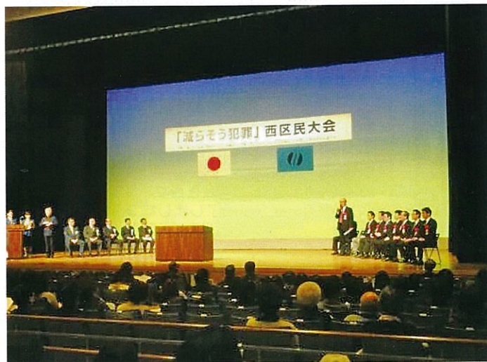
H26.2.15 「減らそう犯罪」西区民大会 西区民文化センター