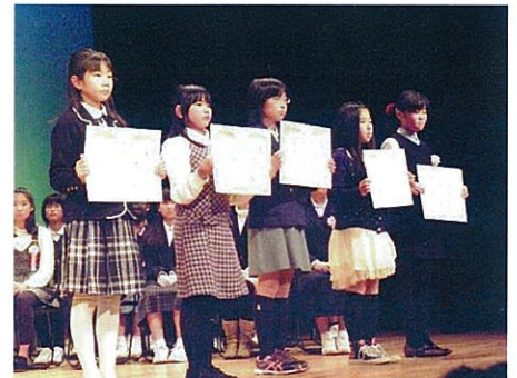
H25.12.25 作文・標語コンテスト表彰式