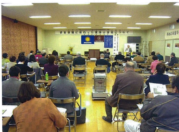
H26.3.11【自主テーマ研修会(更女共催)】