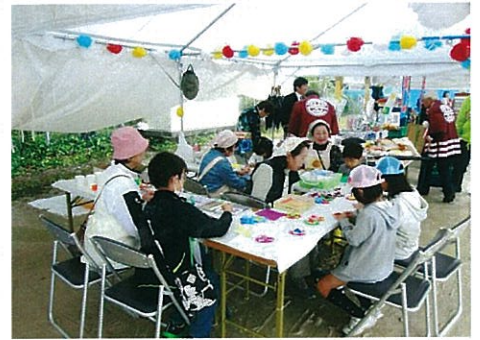
H25.11.3 西区民まつり・子育て支援（更女）