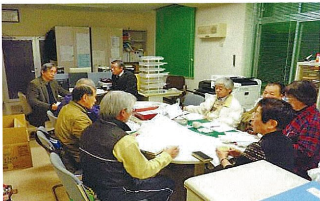
毎月1回・企画調整会議開催各月の行事確認・一ヶ月の当番日の確定等を決定しております。