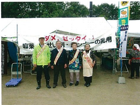
H25.11.3 西区民まつり・薬乱指導員