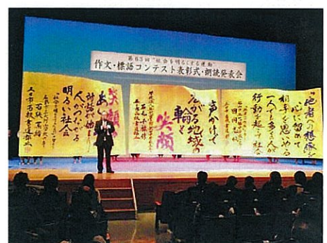
H25.12.25 作文・標語コンテスト表彰式 副委員長による閉会のことば。