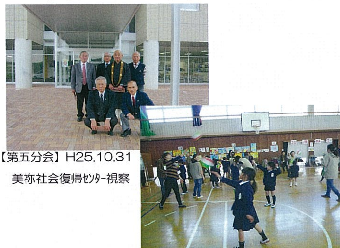
【第五分会】H25.10.31 美祢社会復帰セカ視察