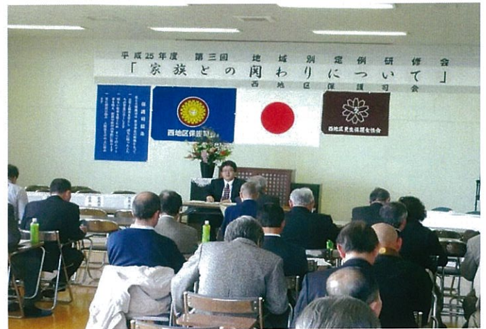
H25.12.5【第三回地域別定例研修】家族との関わりについて 於:広島・西区更生保護庁一センター