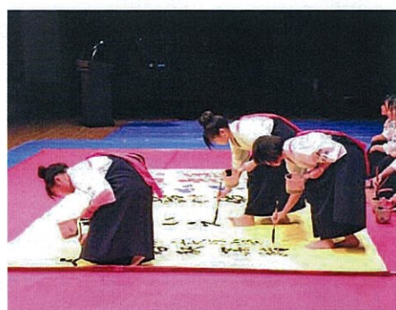
H25.12.25 作文・標語コンテスト表彰式 五日市高校生による書道パフォーマンス