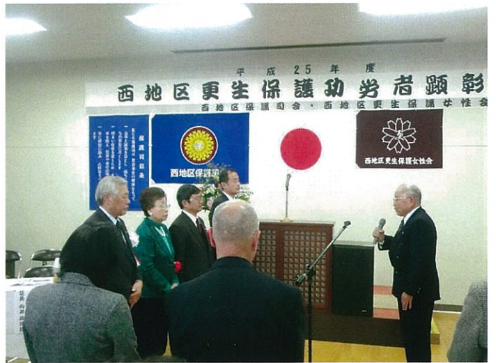
H25.12.5 西地区更生保護功労者顕彰式 受章者 謝辞