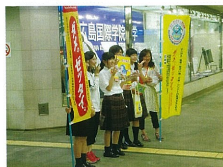
H25.7.5 “社明運動” 一日観察所長行事 街頭啓発