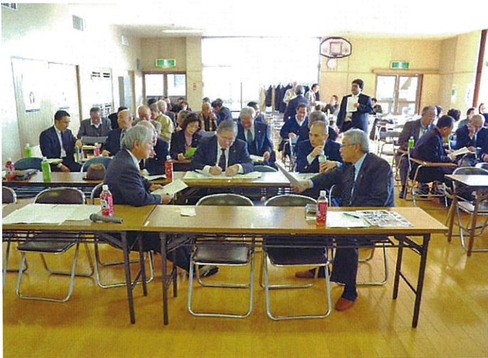
H26.2.4【第四回地域別定例研修】