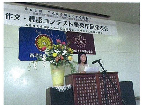
H26.2.22 西区推進委員会において 朗読発表