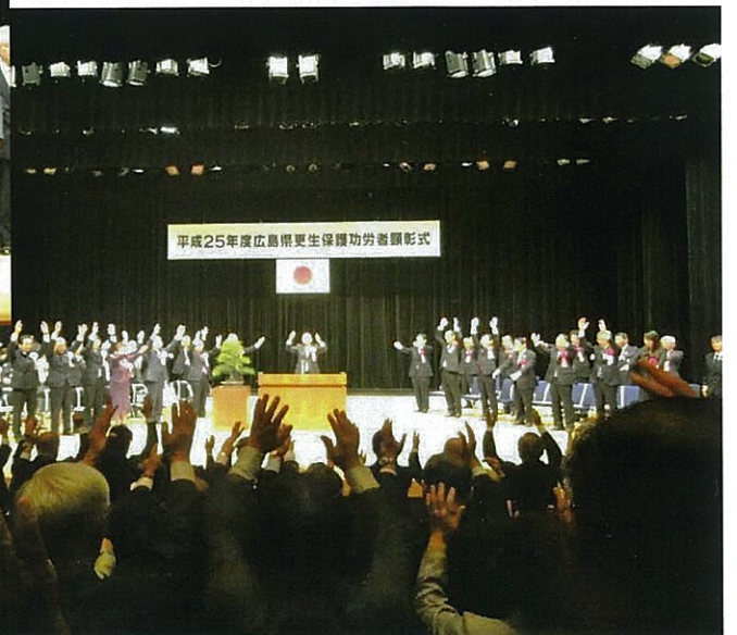
会場全員による万歳三唱