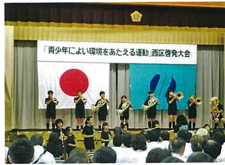
H25.7.6 青少協・井口明神小学校