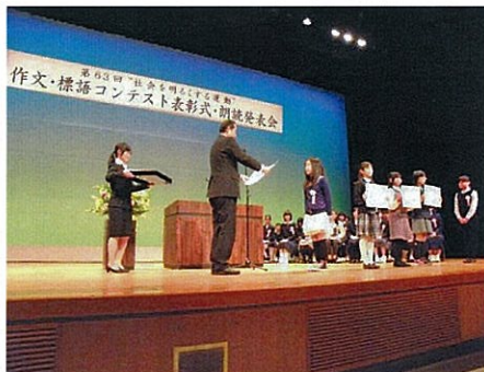
H25.12.25 作文・標語コンテスト表彰式