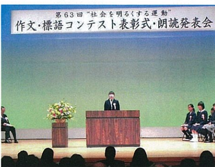
H25.12.25 作文・標語コンテスト表彰式 優秀作品朗読発表