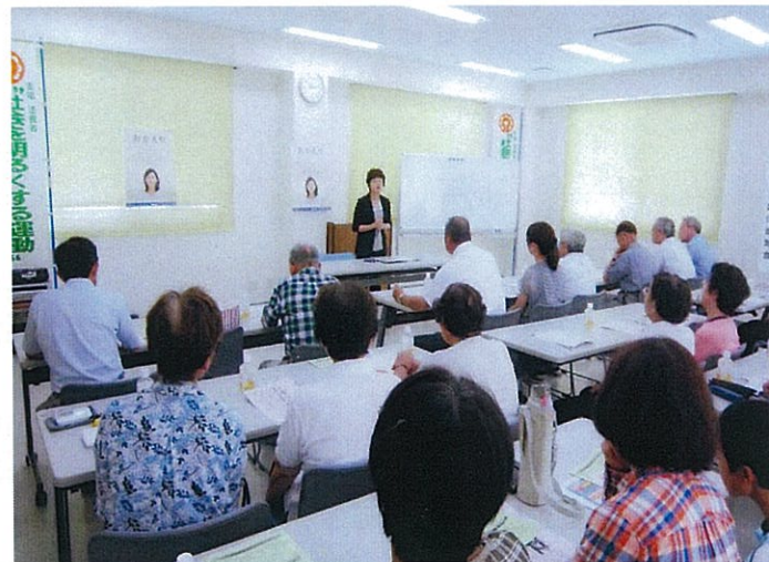
【第六分会】H25.12.14 保護司と地域の関わりについて