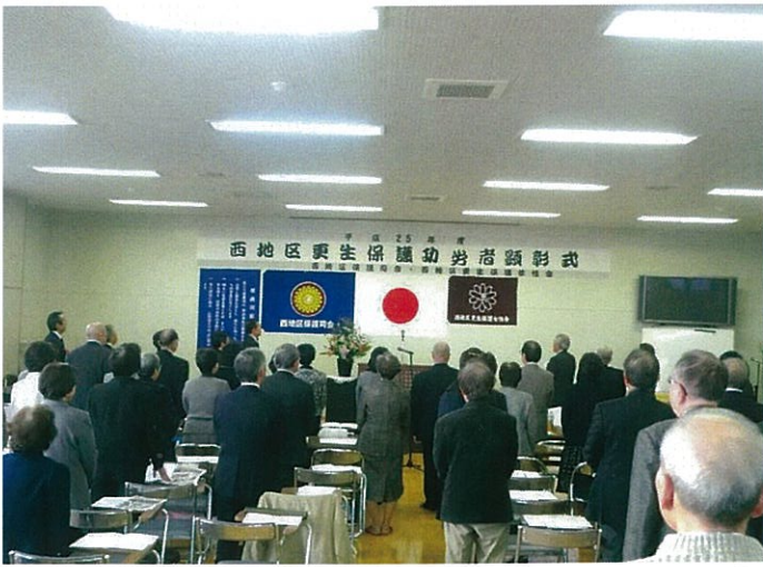
H25.12.5 西地区更生保護功労者顕彰式 広島・西区更生保護所 表彰