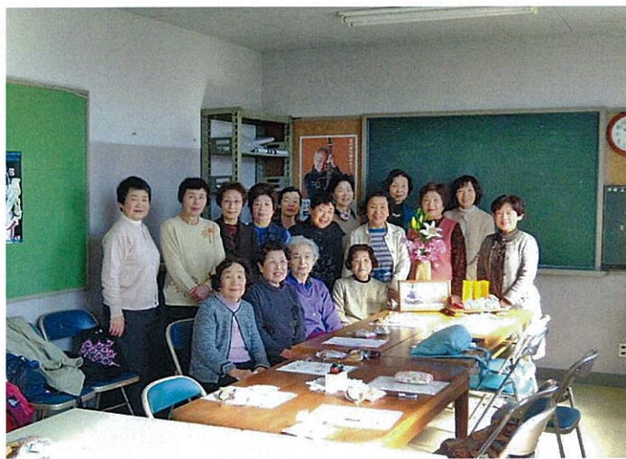
【第二分会】H26.3.3 更女の皆さんと一緒にひな祭り会