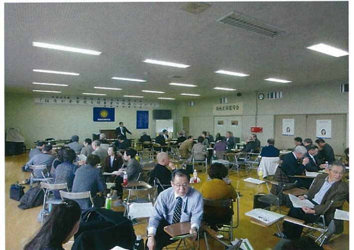
H26.2.4【第四回地域別定例研修】