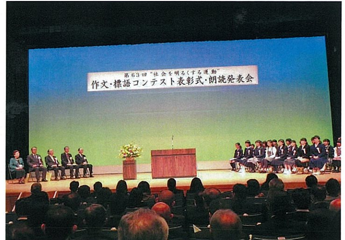
H25.12.25 作文・標語コンテスト表彰式・朗読発表会 於: 西区民文化センター

広島保護観察所主催「作文・標語コンテスト表彰式・朗読発表会」が開催され、西地区保護司会より28名の会員が参加しました。今年度のコンテストには、小学生の部・作文3作品 中学生の部・作文3作品 標語3作品を県推進委員会に提出(推薦)しました。そのうち中学生の部で、作文2作品・標語2作品が入選されました。次年度も学校側に働きかけて良い作品を推薦出来るようにしたいものです。