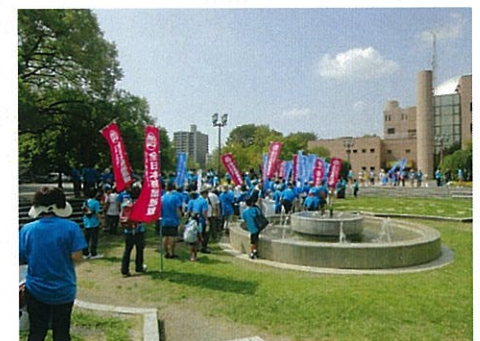
H25.9.23 「薬乱」リハビリパーク ハーバー公園