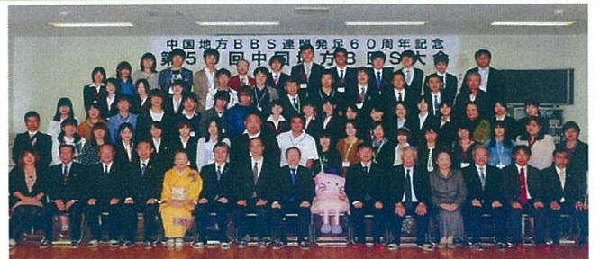
H25.10.26 第59回中国B.B.S大会を当サポセンにて開催され企画調整保護司の支援で、盛会に終了しました。(特報発行済み)