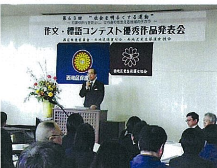
H26.2.22 西区推進委員会 当サポートセンターにおいて 松井広島市長の激励あいさつ