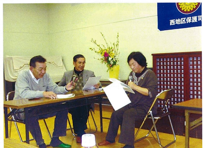
H26.3.11【自主テーマ研修会(更女共催)】