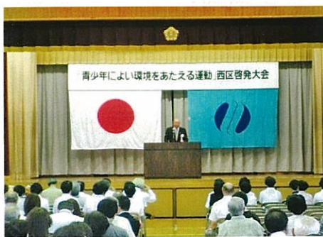
H25.7.6 青少協・井口明神小学校