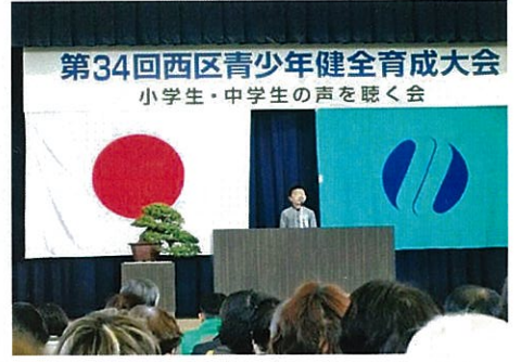
H25.11.23 青少協・井口中学校