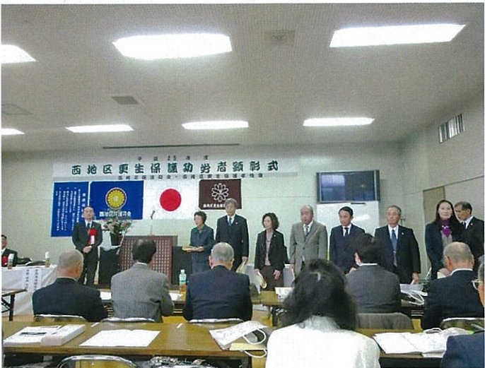
H25.12.5 西地区更生保護功労者顕彰式 広島県保護司会連合会長 表彰